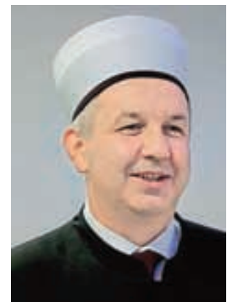
Slavnostni govornik na odprtju je bil mufti Nedžad Grabus.

"Na Jesenice me vežejo lepi spomini. To je edino mesto, v katerem sem delal kot imam. Ta izkušnja mi je precej pomagala pri opravljanju funkcije muftija v Sloveniji," je dejal mufti Nedžad Grabus.