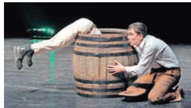
Na Čufarjevem odru se je zvrstilo šest tekmovalnih predstav.