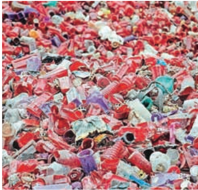
Letno v Plastkomu zberejo in predelajo do 1200 ton odpadnih sveč.

ločijo parafinske od elektronskih. Parafinske grede naprej v stroje, najprej v trgalce, nato pa v mline, kjer se plastika zmelje. Vosek se predela posebej, prav tako ločijo pokrovčke. Predelano plastiko prodajo kupcem v tujino, zlasti v Nemčijo in Italijo, in se uporablja v gradbeništvu. Tudi vosek prodajo v Nemčijo, uporabljajo ga za izdelavo prižigalnikov za peči, del pa tudi za nove sveče. Aluminijske oziroma železne pokrovčke oddajo pooblaščenemu podjetju in se kot surovina ponovno uporabijo zlasti v železarski industriji. Več dela imajo z elektronskimi svečami, kjer morajo ročno ločiti pokrovček, ki ga edinega lahko predelajo. Ostale dele (baterije