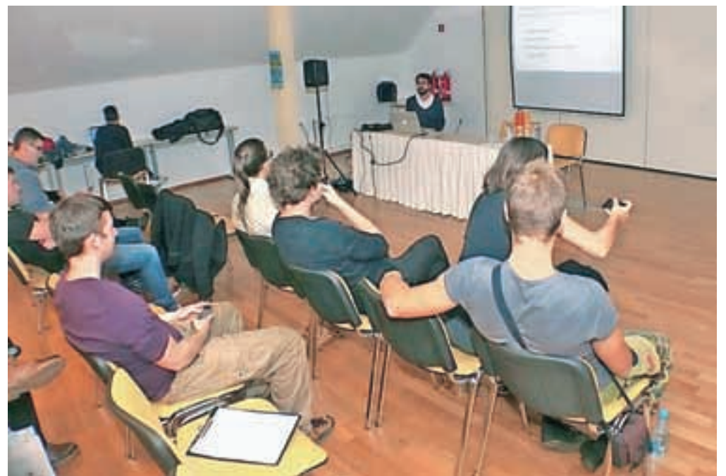
Delavnica o coworkingu

V dvorani Kolpern na Stari Savi je Mladinski svet Jesenice pripravil Tržnico znanja, na kateri so se predstavljala nekatera jeseniška podjetja in organizacije, udeleženci pa so dobili praktične nasvete o iskanju zaposlitve in zaposlitvenih možnostih. Tržnica znanja se je odvijala v sklopu projekta Zabavaj se v mestu, ki ga je organizira občina Jesenice, poleg tržnice znanja pa so pripravili tudi brezplačne vodene ogledne Gornjesavskega muzeja Jesenice in muzejskega območja Stara Sava. Na dopoldanski tržnici znanja so se predstavila podjetja in društva, in sicer Adecco, Mojedelo, Obrtna zbornica Jesenice, Ragor – razvojna agencija s predstavitvijo točke VEM in Europe Direct, Hidria Rotomatika, TIC Jesenice, Outwet, Klub Zlata Ribica, Camping Perun, Ejga Jesenice, Projekt natura in Planinsko društvo Jesenice. V popoldanskem času pa so pripravili vrsto predavanj in delavnic na temo samozaposlitve, sodelovanja po principu Coworking ter skupinskega finan-