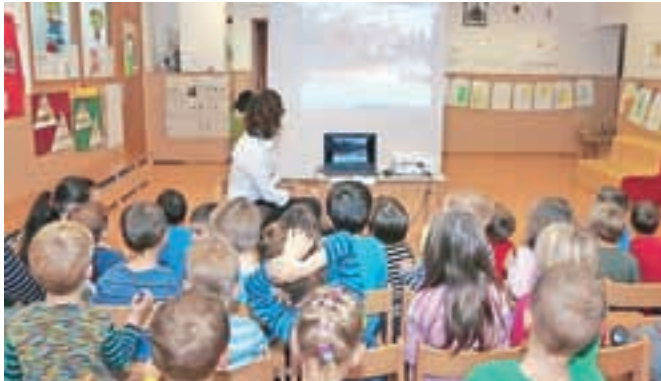
Jeseniški otroci v vrtcu na Hrušici v pogovoru z vrstniki iz Litve

Sicer pa je bil november peser v jeseniških vrtcih, saj jih je obiskala tudi Sapramiška, glasnica Botrstva v Sloveniji, ki je dva tedna preživela ravno v vrtcu na Hrušici in spremljala, kako so starši in otroci darovali igrače, knjige in šolske potrebščine za projekt Botrstvo.