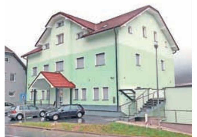
Stavba na Skladišni ulici, v kateri bo tudi restavracija.