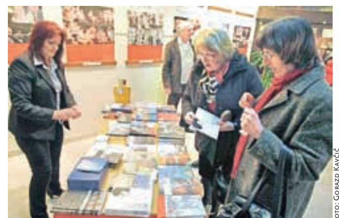
Gornjesavski muzej Jesenice v avli gledališča pripravlja knjižni sejem in muzejsko razstavo Jeseniška Talijska.