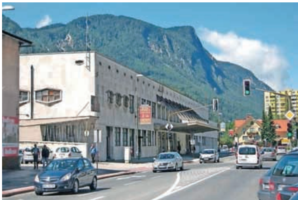
Železniška postaja ob Cesti maršala Tita danes