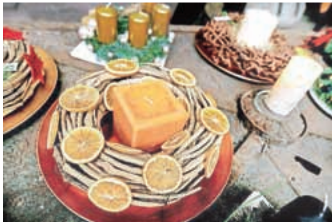
V prejšnjih letih so na delavnicah nastali različni čudoviti adventni venčki.