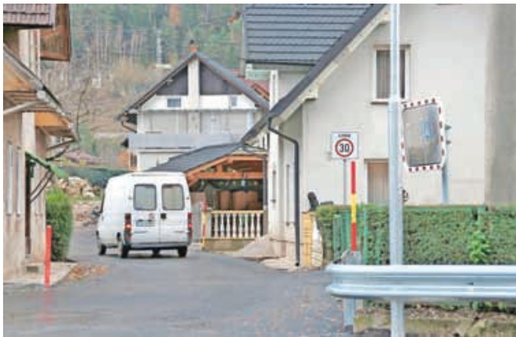
Kurja vas je postala cona 30.