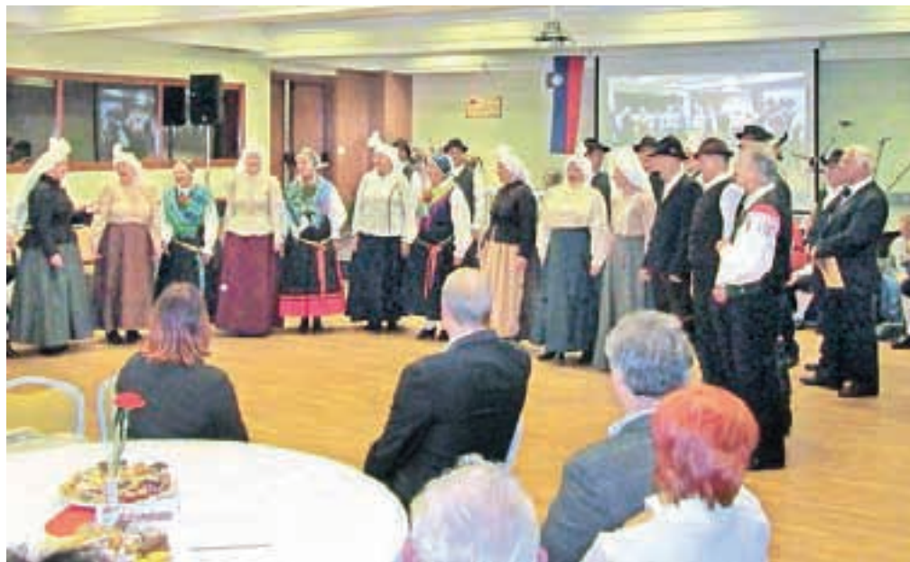
Juliana je dvajsetletnico delovanja počastila z nastopom v Kranjski Gori.