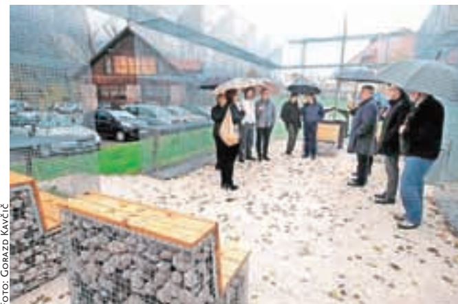
Odprtje funkcionalne urbane opreme na Stari Savi

Arhitekturno so projekt zasnovali v družbi Styria Arhitektura iz Maribora, vsebinsko pa je sodeloval Gornjesavski muzej Jesenice. Projekt MOTOR je sofinanciran v okviru Programa čezmejnega sodelovanja Slovenija-Italija 2007–2013 iz sredstev Evropskega sklada za regionalni razvoj in nacionalnih sredstev.